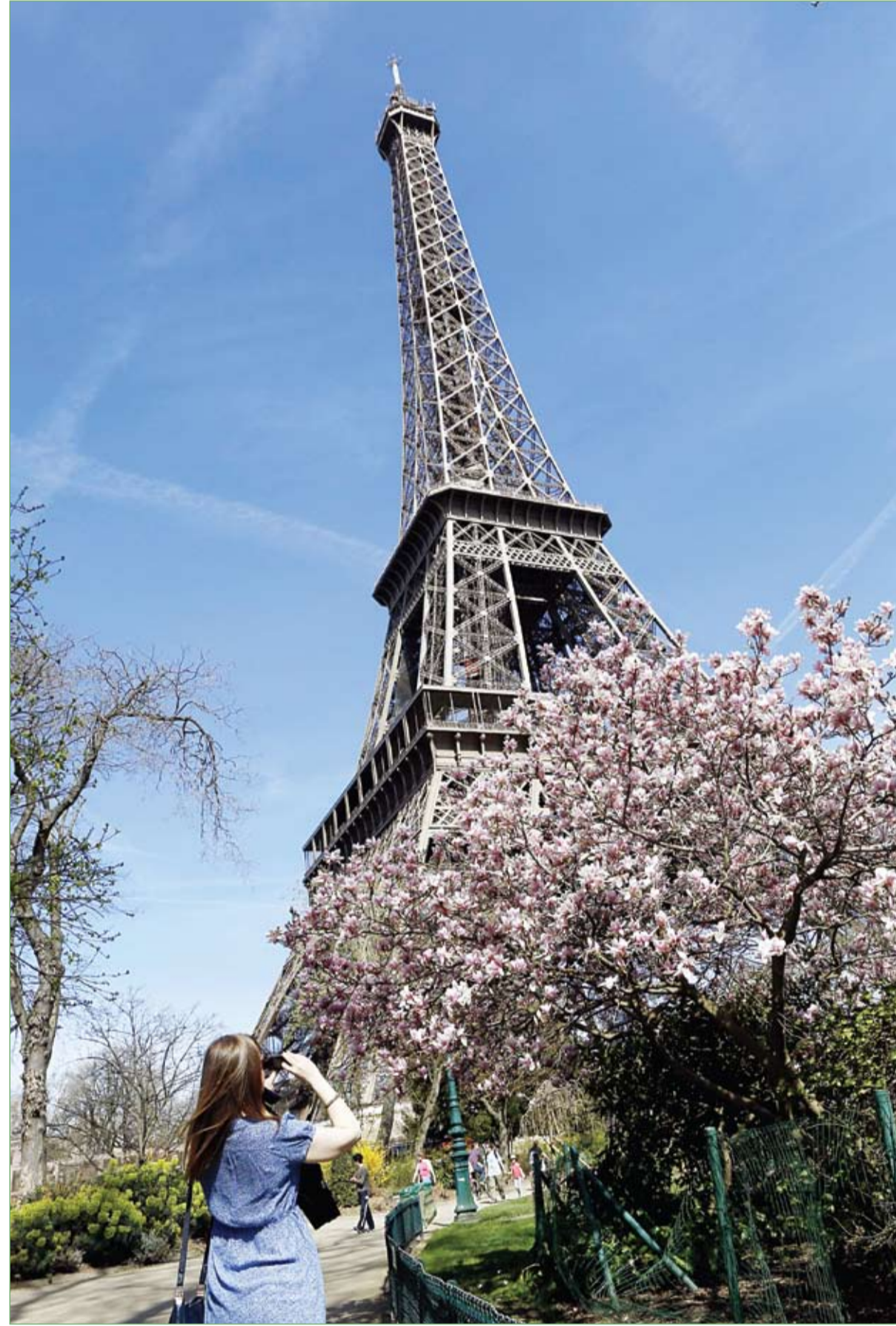
امرأة تلتقط صورة للأشجار المزهرة بالقرب من برج إيفل في باريس.

ومنذ بداية احتجاجه، تمدد الشرطة بالماء، ولكنه حتى صباح اليوم الرابع لم يتلق أي طعام. واحتشد عشرات الآباء المنفصلين عن زوجاتهم أسفل الرافعة تضامنا مع تشرناي، ويهتف الكثيرون بنظام القضاء الفرنسي بتجاهل حقوق الآباء.